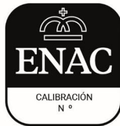
FIGURA 1 ETIQUETAS DE CALIBRACIÓN PUEDEN EXISTIR CASOS EN LOS QUE EL TAMAÑO DEL PRODUCTO O ELEMENTO MOTIVO DE LA CALIBRACIÓN SEA DE DIMENSIONES REDUCIDAS POR LO QUE SE ESTABLECE ESTA APLICACIÓN ESPECIAL

EL ESPACIO PARA LA CODIFICACIÓN SITUADA EN LA PARTE INFERIOR QUEDARÁ MUY REDUCIDO POR LO QUE SE DEBE TENER ESTA CUESTIÓN PRESENTE A LA HORA DE SU IMPRESIÓN